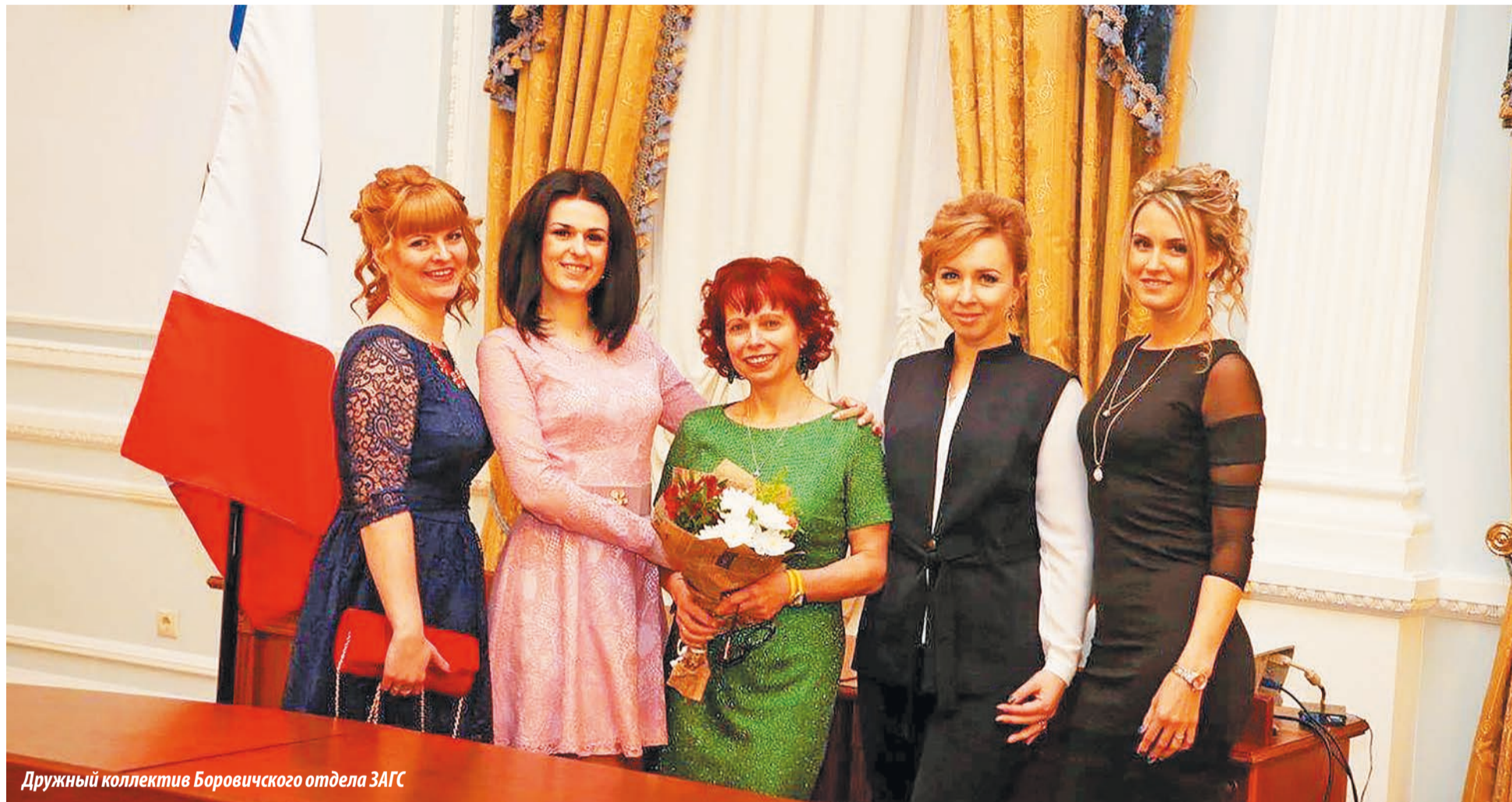
Дружный коллектив Боровичского отдела ЗАГС