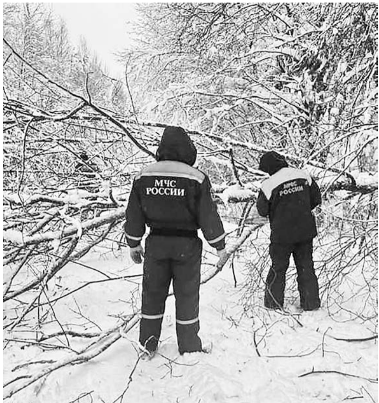
Ситуация в районе остается нестабильной, восстановительные работы продолжаются