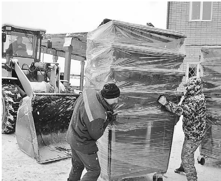
Идет разгрузка новых контейнеров для мусора